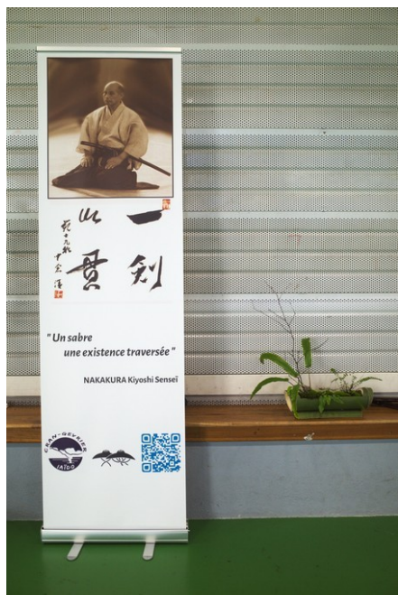
Un sabre, une existence traversée

Certains s'inscrivent dans la ligne directe de ce qui a été vu samedi ( Saken, Sateki ) d'autres font dans le spectaculaire ( Konotegashiwa, Kakari doshi ) ou le bizarre ( Tsubame gaeshi ).