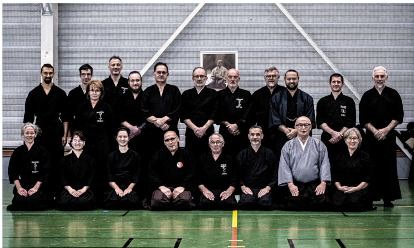
La traditionnelle photo de groupe

Après un stage de retrouvaille à Tours en mars 2022, le clan Yagyû s'est à nouveau réuni cette fois à Annecy en ce mois de novembre pour un stage koryû .