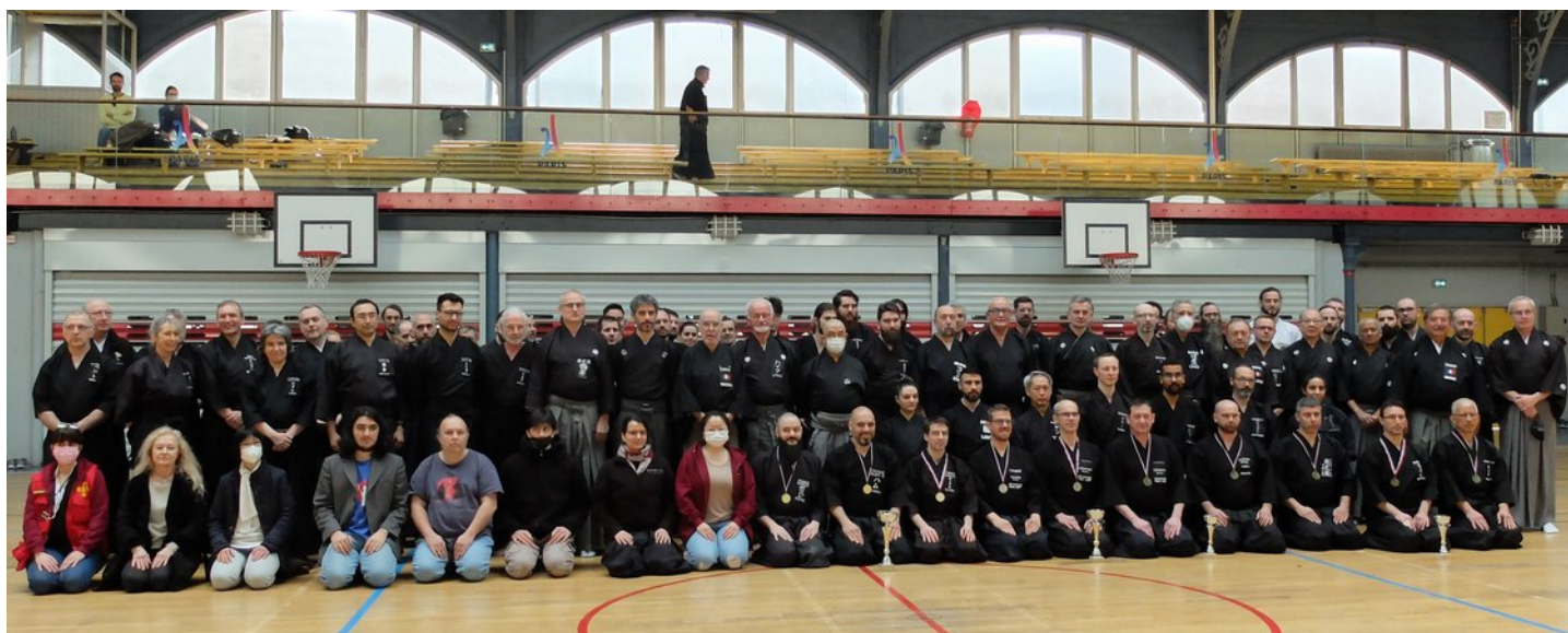
Participants aux Championnats par Equipes