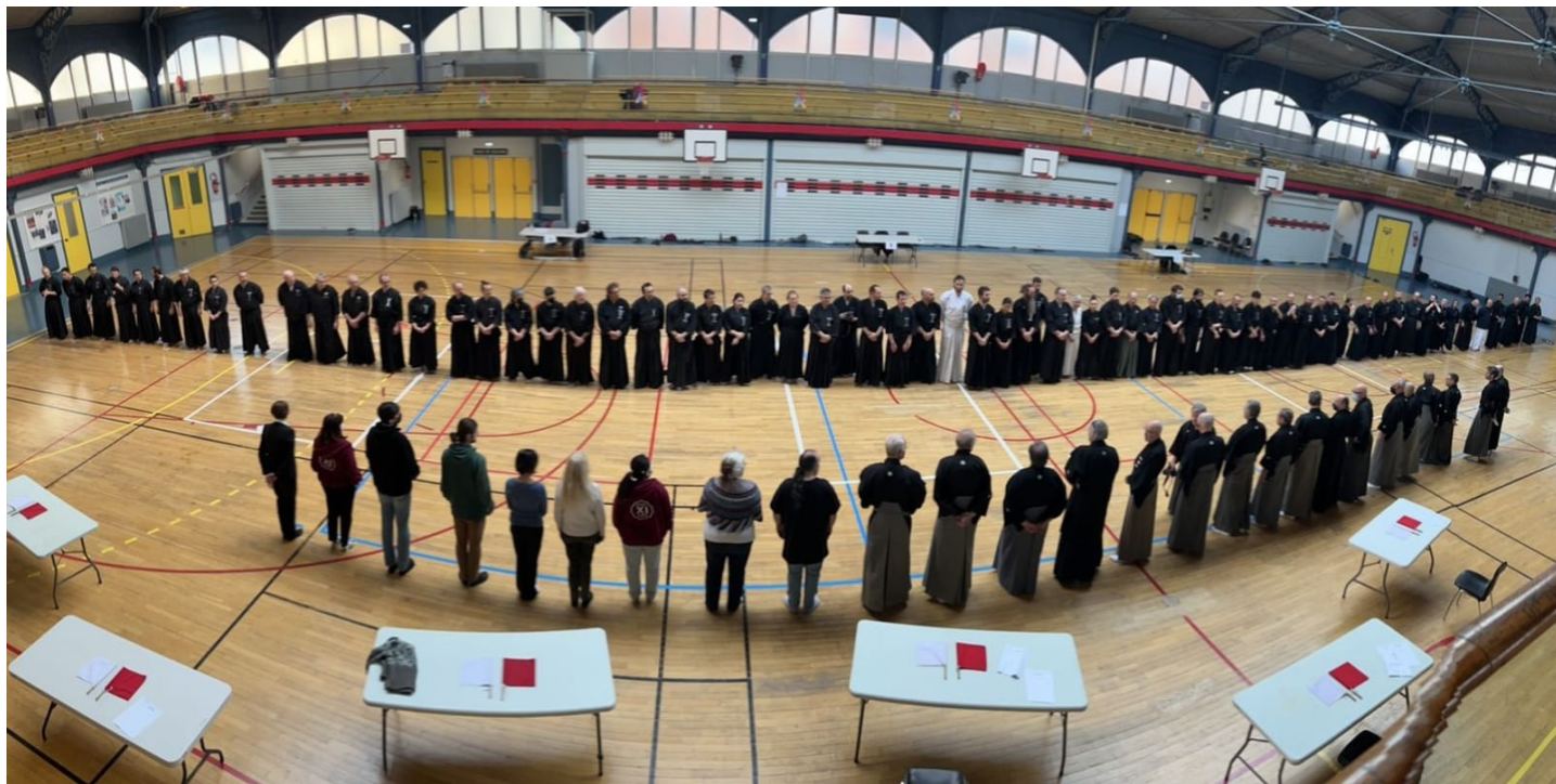
Participants aux Championnats en Individuels

Félicitations encore à tous pour le travail réalisé.